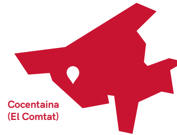
Cocentaina (El Comtat)

Cocentaina, la històrica vila del Comtat (11.500 habitants). Un lloc amb pintures rupestres protegides per la Unesco i amb presència de la cultura ibera. Just allà és on naixen el compositor Gustavo